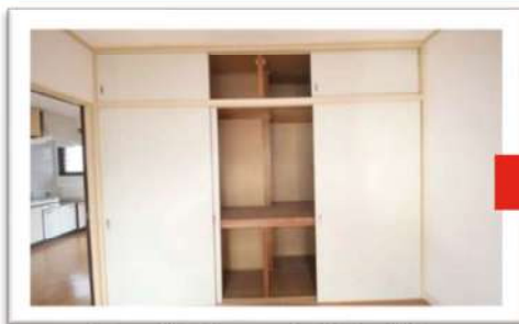
押入だと片面しか開かず使いづらい……